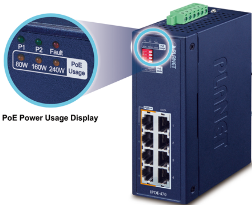
PoE Power Usage Display