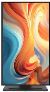
Pivot : -90°~90°