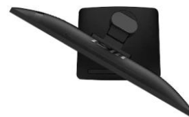
Swivel : -45°~45°