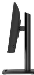
Tilt : -5°~20°