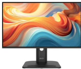
Height : 0~130mm